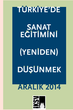
Türkiye'de Sanat Eğitimi (Yeniden) Düşünmek, Aralık 2014