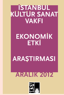
İstanbul Kültür Sanat Vakfı Ekonomik Etki Araştırması, Aralık 2012