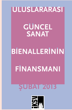
Uluslararası Güncel Sanat Bienallerinin Finansmanı, Şubat 2013