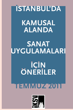
İstanbul'da Kamusal Alanda Sanat Uygulamaları İçin Öneriler, Temmuz 2011

İKSV'nin kültür politikaları çalışmaları kapsamında hazırlanan bu rapora ve daha önce yayımlanan aşağıdaki tüm raporlara iksv.org web sitesinden ve İKSV Kitaplık uygulamasından ulaşabilirsiniz.